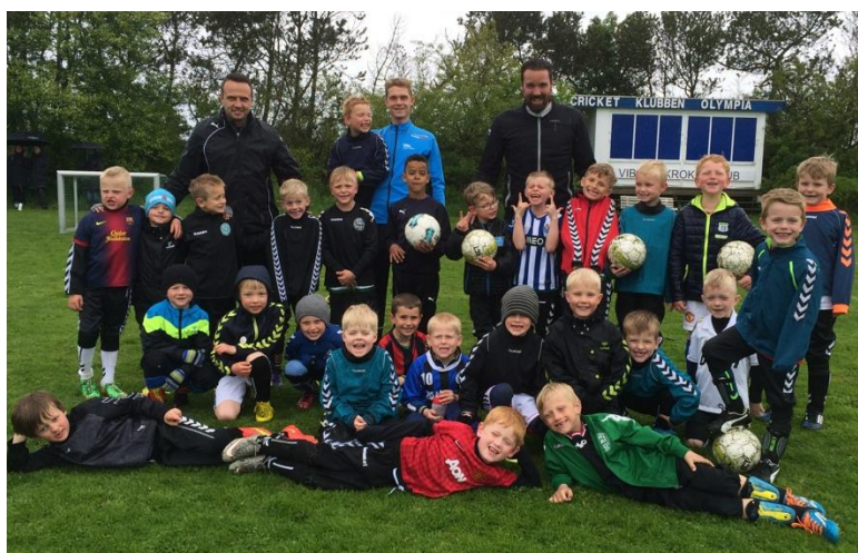
Trænerteamet U-7 drenge

Ellers er vi begyndt så småt begyndt at forberede os på de større baner vi skal på efter sommerferien. Der trænes indimellem på stor bane, hvilket går rigtigt godt. Det skal de nok komme efter. Sidst vil vi ønske alle en god sommer.